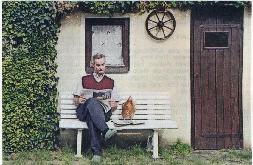
Der witzige Film „Herr Peters und das Huhn“ von Ohm-Studenten bekam den ersten Preis in der Kategorie „Professional“.

Damit andere Filmemacher nicht vergeblich auf Preise warteten, arbei-